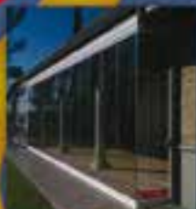
CORTINAS DE VIDRIO