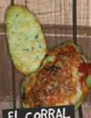
EL CORRAL DE TRIANA