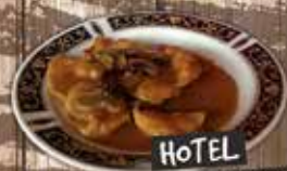
HOTEL SAN CRISTÓBAL