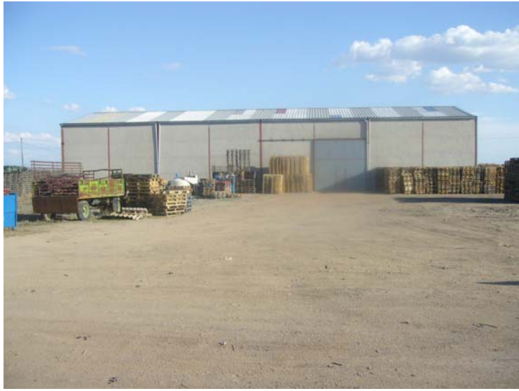
VISTA INTERIOR DE LA PARCELA Y EL PATIO CON LA NAVE AL FONDO

“Almacenamiento temporal y gestión de residuos plásticos y palets” en parcela resultante de la agregación de las número 19 y 20 del polígono 4 de la Cistérniga.- Valladolid.