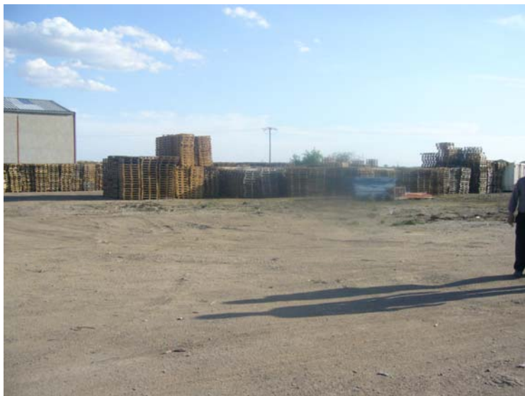
VISTA INTERIOR DE LA PARCELA Y EL PATIO EN DIRECCIÓN AL CN°. DE TRES ALMENDROS