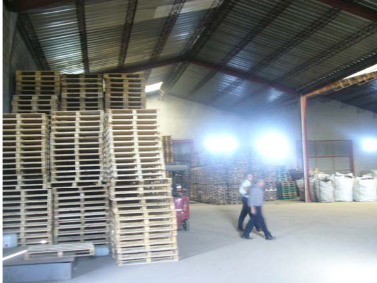
VISTA INTERIOR DE LA NAVE - ALZADO INTERIOR AL CAMINO REAL CON ACOPIO DE PALETS

“Almacenamiento temporal y gestión de residuos plásticos y palets” en parcela resultante de la agregación de las número 19 y 20 del polígono 4 de la Cistérniga.- Valladolid.