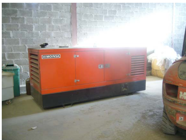
VISTA INTERIOR DE LA NAVE – GRUPO ELECTRÓGENO