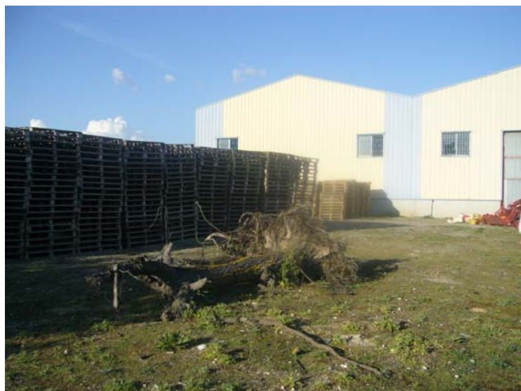
VISTA INTERIOR DE LA PARCELA Y EL PATIO DESDE LA PARTE POSTERIOR DE LA NAVE