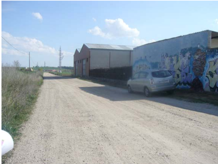
VISTA EXTERIOR DE LA PARCELA DESDE EL CAMINO REAL-EN PRIMER PLANO LA PARC.20

“Almacenamiento temporal y gestión de residuos plásticos y palets” en parcela resultante de la agregación de las número 19 y 20 del polígono 4 de la Cistérniga.- Valladolid.