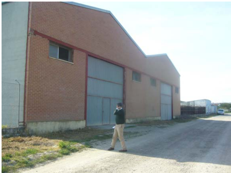
VISTA EXTERIOR DE LA PARCELA DESDE EL CAMINO REAL-EN PRIMER PLANO LA PARC.19