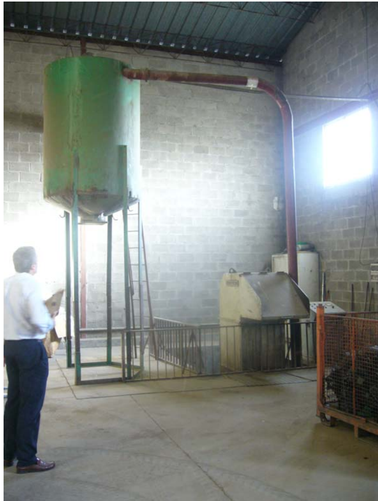
VISTA INTERIOR DE LA NAVE - MOLINO

“Almacenamiento temporal y gestión de residuos plásticos y palets” en parcela resultante de la agregación de las número 19 y 20 del polígono 4 de la Cistérniga.- Valladolid.