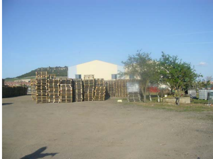
VISTA INTERIOR DE LA PARCELA Y EL PATIO DESDE EL CNº. DE TRES ALMENDROS HACIA LA NAVE

“Almacenamiento temporal y gestión de residuos plásticos y palets” en parcela resultante de la agregación de las número 19 y 20 del polígono 4 de la Cistérniga.- Valladolid.