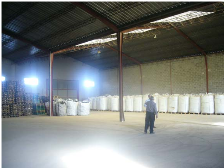
VISTA INTERIOR DE LA NAVE - ALZADO INTERIOR AL CAMINO REAL -ACOPIO DE SACAS DE PLASTICO